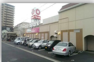
食品スーパー【スパーク】