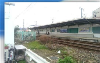
路面電車【広島電鉄】