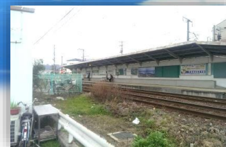
路面電車【広島電鉄】