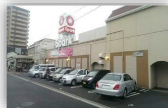
食品スーパー【スパーク】