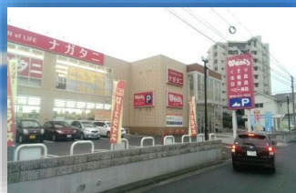
ドラッグストア【ウォンツ】