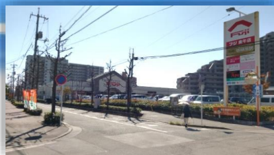
食品スーパー【フジ】