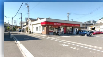
コンビニエンスストア【ポプラ】