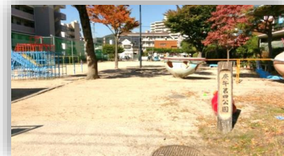
公園【庚午第四公園】