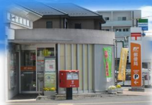
郵便局【広島南観音郵便局】