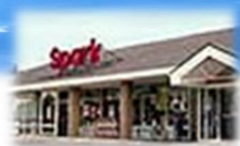
食品スーパー【スパーク】