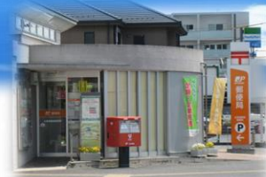
郵便局【広島南観音郵便局】